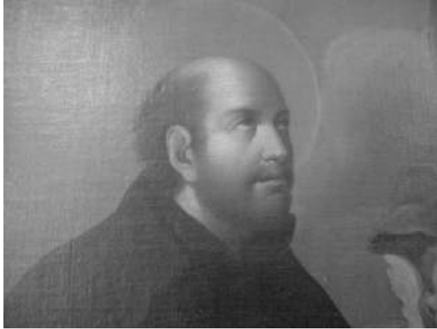
José de Calasanz (detalle)

la Virgen María y el Niño Jesús en brazos, quienes coronan la escena; un conjunto de querubines resguardan a la Virgen, sentada en un trono celestial, mientras que otro porta, a manera de estandarte, un ramo de azucenas, símbolo de la pureza; la escena nos narra la misión educadora de José de Calasanz, 6 así como su profunda filiación mariana. El óleo tiene como remate inferior una inscripción, a la usanza de la pintura novohispana, que dice- “S. José Calasanz de la Madre de Dios. Fundador de las Escuelas Pías”. 7