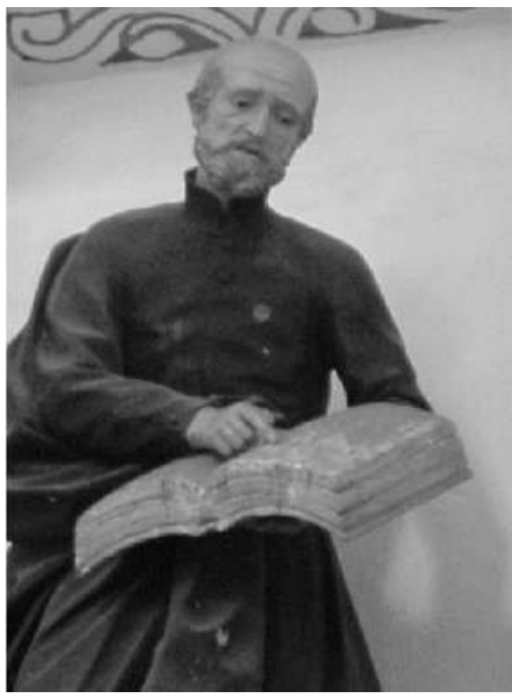
El beato Calasanz Casa de las bóvedas (detalle).