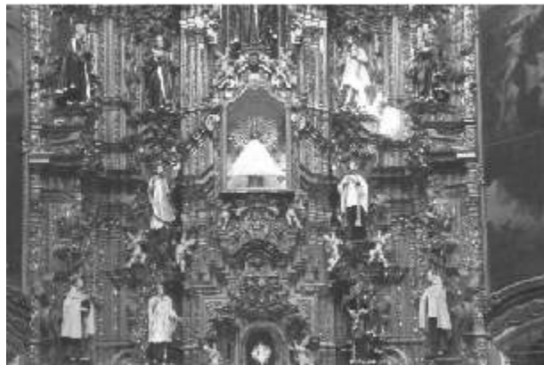
Templo de la Enseñanza, Retablo de la Virgen del Pilar. México, D. F.