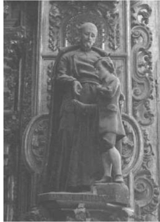
Santuario de Nuestra Señora de Ocotlán, Tlaxcala. Retablo de la Virgen de Guadalupe. San José Calasanz.

En el Distrito Federal, a la fecha, hemos identificado tres obras relativas a José de Calasanz, una de ellas situada en el Retablo de la Virgen de Zapopan , en la Catedral Metropolitana , este es un retablo estípite fechado entre 1760 y 1770, 10 cuyo programa iconográfico se compone de pinturas al óleo, entre las que se encuentran San Agustín, San Juan Bosco, San Felipe Neri, San Ignacio de Loyola, San Antonio María Claret y San José de Calasanz, el cual se sitúa en el lado izquierdo del remate (ático) del retablo; 11 en esta obra, de autor desconocido, del segundo tercio del siglo XVIII, el retrato de cuerpo entero de Calasanz se muestra como un joven fraile que sostiene en la mano un libro cerrado y, sobre éste, un reloj de arena.